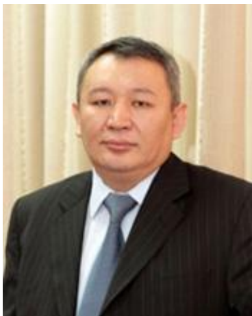
БЕКТЕМИРОВ Куаныш Абдугалиевич

Во исполнение поручения Главы государства в целях обеспечения оптимального изучения недр страны, воспроизводства и укрепления минерально-сырьевой базы, а также обеспечения реализации экономических и геополитических интересов Казахстана в казахстанском секторе Каспийского моря Правительством Республики Казахстан в июне 2011 года принято решение о создании Акционерного общества «Национальная геологоразведочная компания «Казгеология».